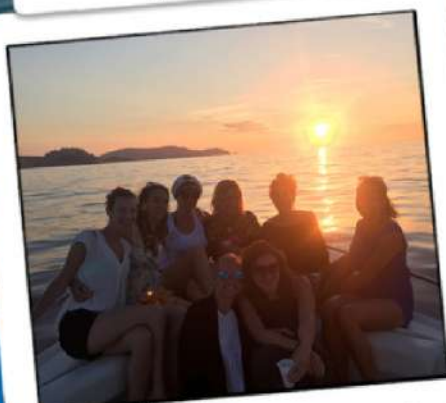
Apéro Coucher de Soleil